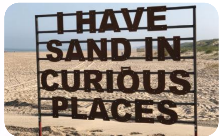
Mocht je zin hebben om 'een stukje' te gaan wandelen, dan zou je er voor kunnen kiezen om dit kunstwerk te gaan bewonderen. Het staat sinds 2018 aan het begin van het naaktstrand in Bergen aan Zee en spreekt erg tot de verbeelding.