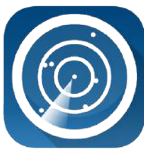
Het logo van Flightradar 24

Gebruik je liever de ouderwetse getijden tabel? Deze is te vinden op de achterzijde van deze krant.