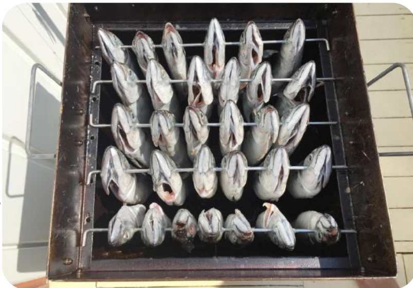
Markrelen die klaar zijn om gerookt te worden. Daarna op een toastje met peper, zout en een kloddertje mayo. Smullen maar!