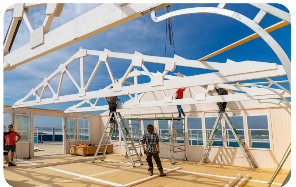
Met personeel, vrienden, familie en strandhuiseigenaren wordt hard gewerkt aan het aanbrengen van het dak.

Met zoveel veranderingen wachten we nog even tot volgend jaar met nieuwe recepten. We zijn ook bezig met 'De strandtas'. In de tas zitten dan 4 biertjes of een fles wijn, kaasjes, worstjes en een opener. Juist nu met corona vinden gasten het soms fijner om hun bestelling mee te nemen en lekker in het zand te zitten of mee te nemen naar de camping hier verderop bijvoorbeeld. De inhoud is van allerlei lokale ondernemingen. "