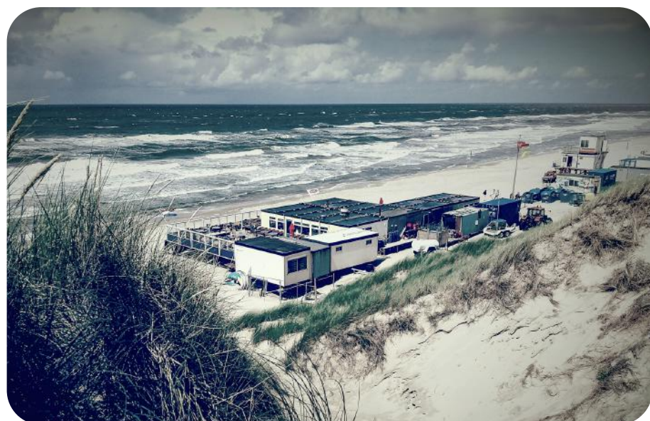
Op deze foto kun je goed zien dat het oude paviljoen uit verschillende containers was opgebouwd. De handel in containers is een vak apart.

Containers? Ja, de snackcorner, de keuken en het kantoor zijn in containers gebouwd. "We hebben de nieuwe containers vorig jaar al op de kop getikt. Alle containers zijn verbouwd en de wanden zijn eruit geweest." Maar hoe en waar koop en verkoop je eigenlijk containers? "Gewoon via marktplaats en via via. Het oude paviljoen wordt nu gebruikt als clubhuis. De ramen van de nieuwe containers hebben we vervangen. Deze oude ramen zijn verkocht en onderweg naar Suriname."