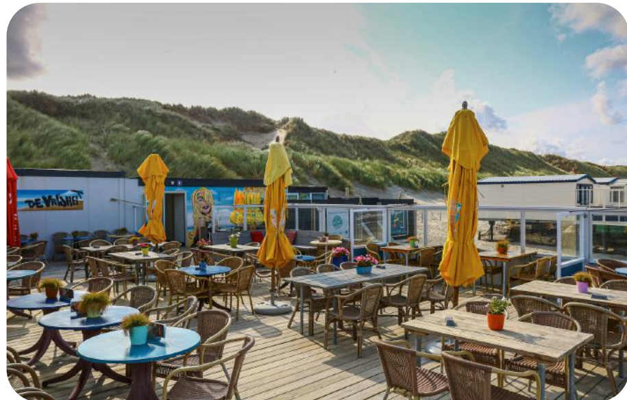
Het sfeervolle zuidterras van het oude paviljoen De Vrijheit aan het begin van een zonovergoten dag in de zomer van 2019.