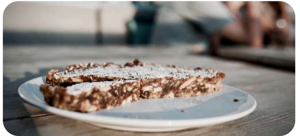
Er worden wel eens stukjes taart geserveerd door de huisjeseigenaren.