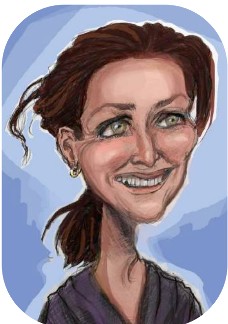
“Das macht kein flaus aus”

Dit en meer is te lezen in het derde nummer van De Strandkrant.