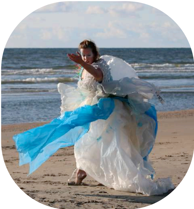
Een dansvoorstelling over het aanspoelen van plastic onder begeleiding van vioolmuziek (Duinfestival 2017).