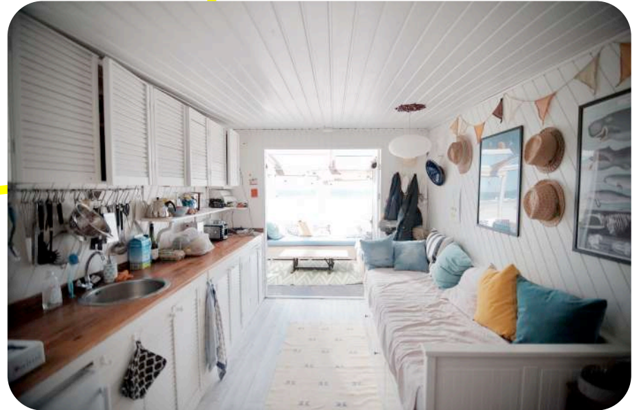
4 Wie: Stijn en Barber met hun kinderen Julius (14), Saar (11) en Ella (7). Op het strand sinds: 2015. Pronkstuk: de inklapbare eet/borreltafel.