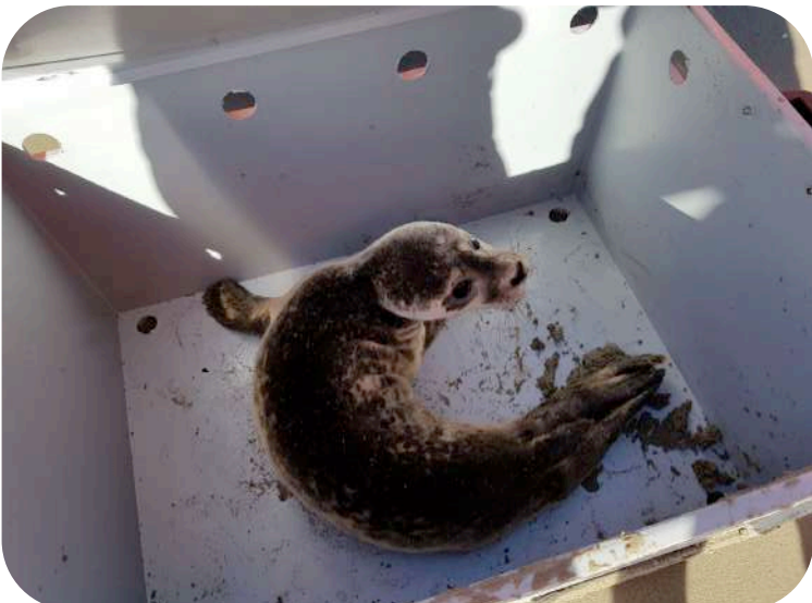
De sterk verzwakte baby zeehond zit in de kist om veilig te worden vervoerd. Inmiddels is hij weer gekalmeerd, maar nog steeds niet relaxed natuurlijk.