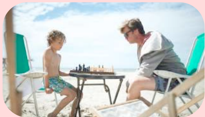
Het wordt zweten geblazen op het schaaktoernooi 18 augustus.

De zon schijnt of het regent of het stuift weer meters zand Nou dat kan ons echt niet deren Wij gaan toch wel naar het strand Voel de wind maar door je haren Zet een lach op je gezicht na vele zonnestrallen Komt vanzelf het evenwicht. Voel de wind maar door je haren Zet een lach op je gezicht na vele zonnestrallen Komt vanzelf het evenwicht.