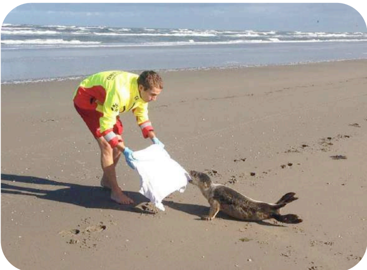
Geleerd op de cursus: probeer zo snel mogelijk een doek over het hoofd van een aangespoelde zeehond te leggen, daar wordt hij rustig van.

Voor wie het in de eerste editie gemist heeft: dit is het wereldberoemde Heemie-konijn. Van Mexico tot aan de Franse kust wordt het herkend.