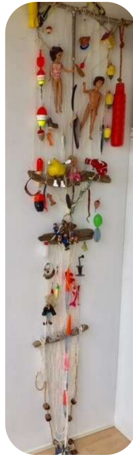
De zelfgemaakte creatie met gevonden voorwerpen op het strand.