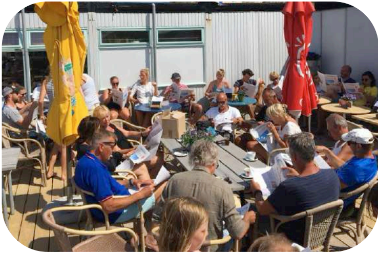
Stilletjes genieten de lezers van de eerste Strandkrant, nadat deze werd uitgedeeld op het paviljoen.

"Wij kunnen niet wachten tot de volgende editie!"