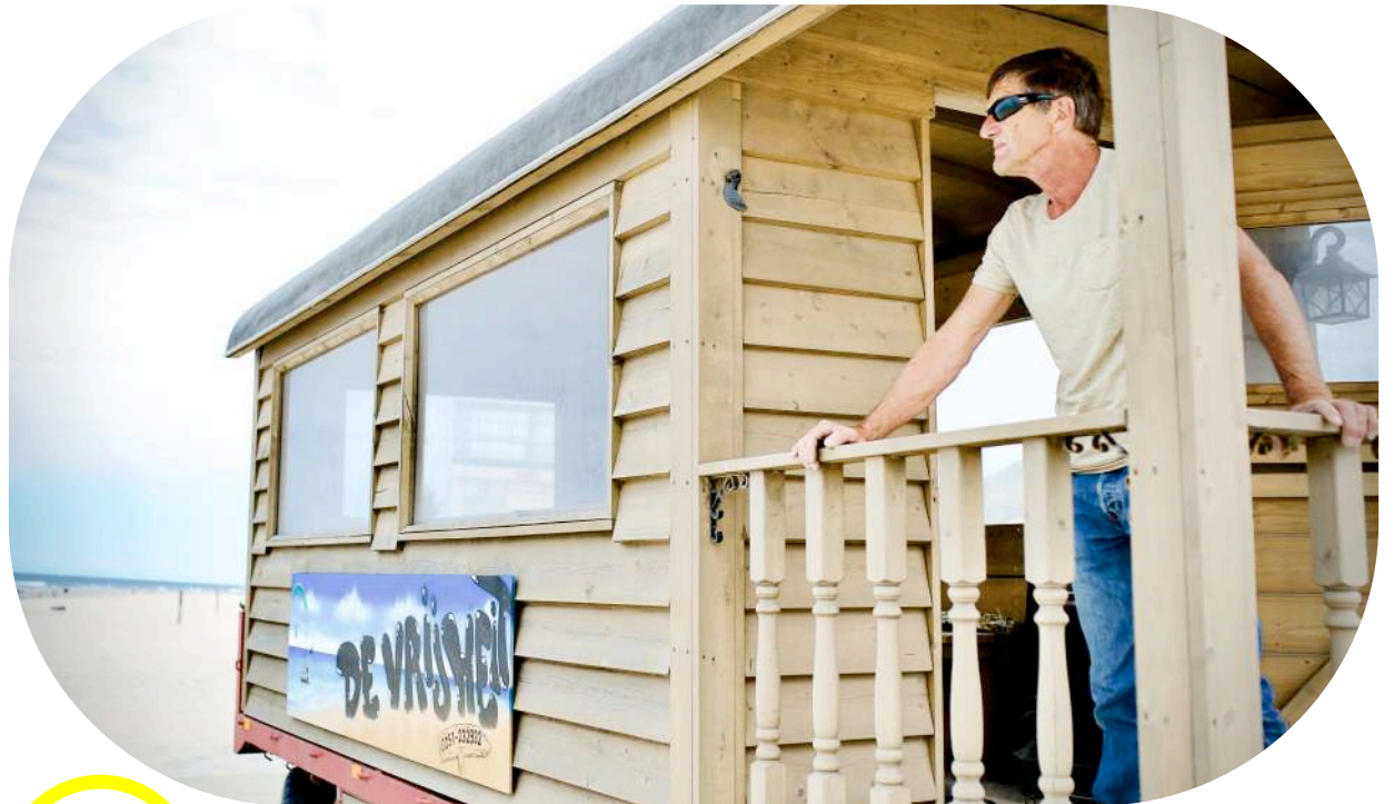
“Als ik moet nadenken pak ik mijn gitaar erbij en kom zo, al spelend, op goede ideeën”

Tekst: Marjan Huisman - Foto: Rianne Schoemaker