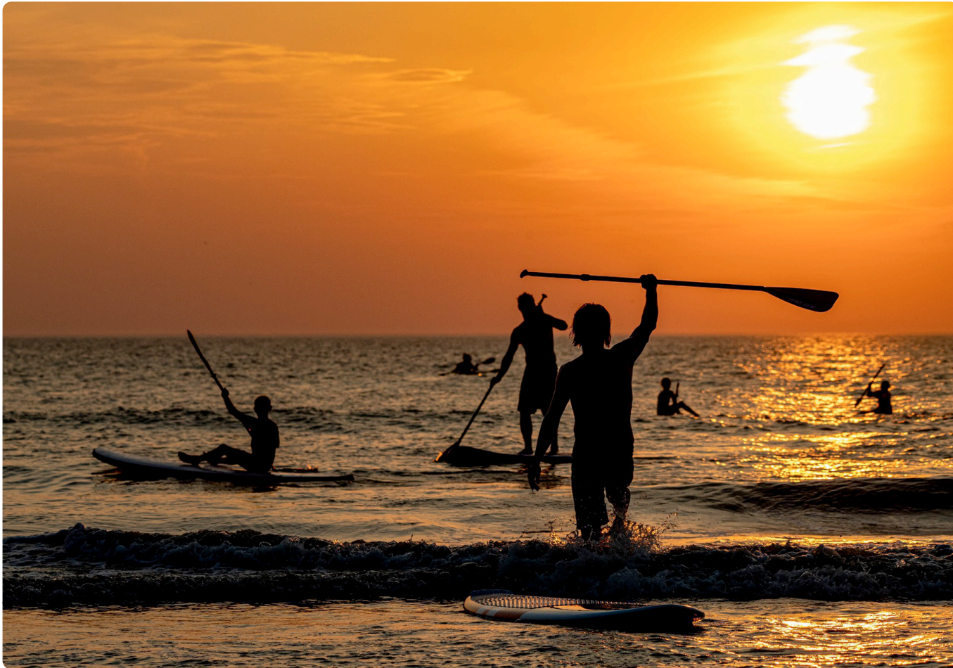
Op een zwoele zomeravond zoeken badgasten en boardsporters op Heemskerk strand verkoeling (2020). We hopen dit seizoen ook weer een paar van deze magische avonden te beleven.