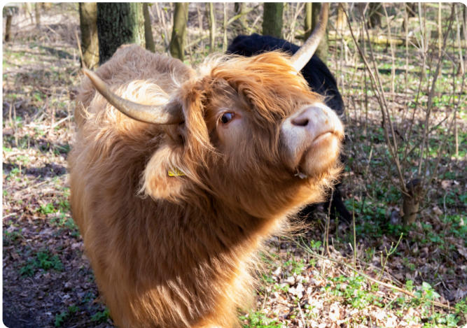
Een nieuwsgierige Schotse Hooglander.

Ooit wel eens afgevraagd waar de naam de Berenweide vandaan komt? En wat heeft koning Willem met duinpiepers te maken? De PWN heeft een route uitgezet die je met andere ogen laat kijken naar ons zeedorpenlandschap. Onderweg heb je een grote kans dat je verschillende viervoeters tegen komt.