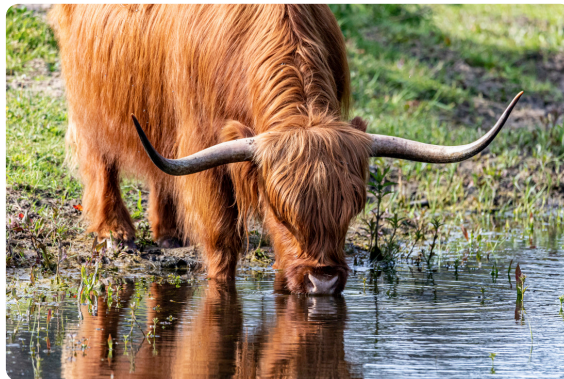
Een Schotse Hooglander die in alle rust aan het drinken is.