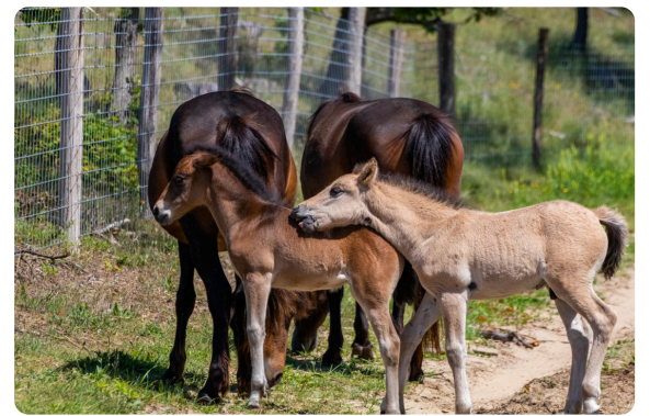
Wilde paarden in de Kennemerduinen