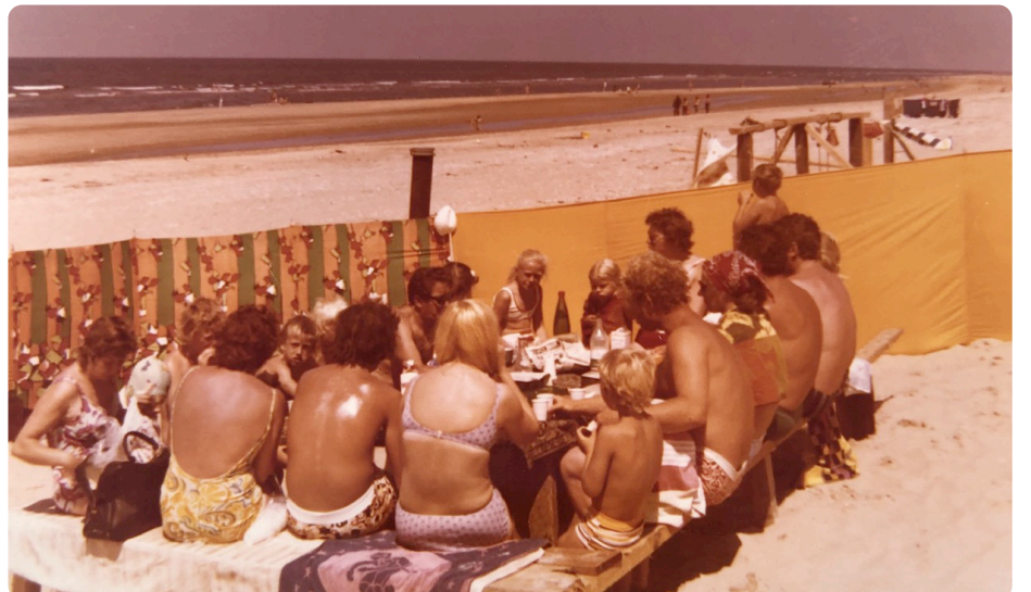
De hele familie aan tafel op een mooie zomerse dag.

De herinneringen zijn zoet, terwijl ze praten komen er steeds meer bovendrijven. Ze zijn intussen al de hele wereld over gereisd maar de mooiste vakanties waren die op het Heemskerkse strand. "Onze belevenissen hebben er voor gezorgd dat de jongste generatie ook fan is, er wordt zelfs gesolliciteerd bij De Vrijheit!