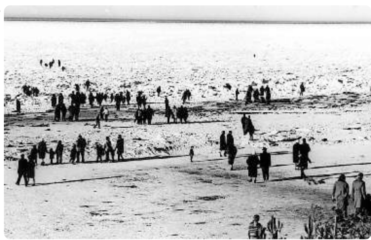
Zo ver je kon kijken, zag je ijs en sneeuw op de zee liggen. Super vet toch?