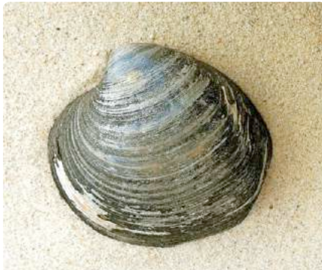
De 'Oude Knar' Noordkromp met zijn onregelmatige groeilijnen.