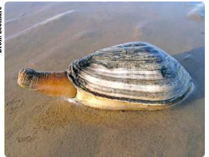
Levende strandgaper met zijn 'gapende' kleppen die voor en achter niet op elkaar aansluiten.