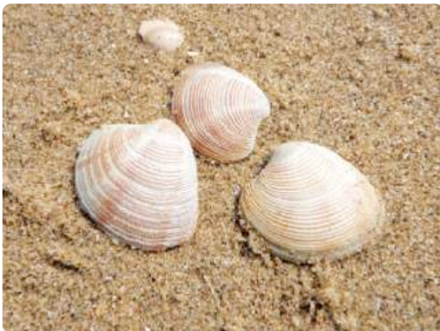
De gewone, maar prachtige venusschelpen. De familie van deze schelpen telt meer dan 500 soorten.