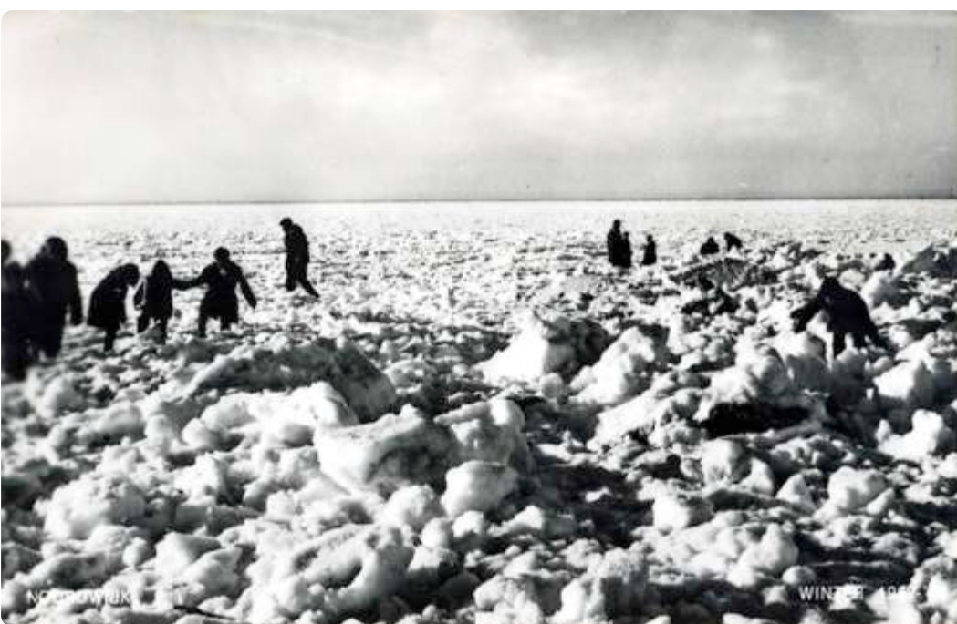
Lopen op de zee kon in 1963. Lekker klauteren en klimmen tussen het ijs en de sneeuwvlokken.