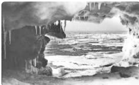
De natuurlijke ijswallen aan de Noordwijkse kust.