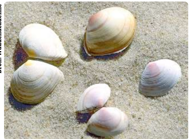
De altijd vrolijke gele en roze (ma)nonnetjes. Veel te vinden aan onze Heemskerkse kust.