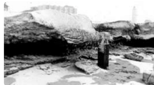
Spectaculaire sneeuwbergen op het strand aan de Nederlandse kust.

Deze winter was alles wat je hoorde en zag op het strand anders. Je zag geen golven meer omslaan en je hoorde ook het ruisen van de zee niet meer. En wat nooit kon, kon toen wel. Je kon lopen op de zee.